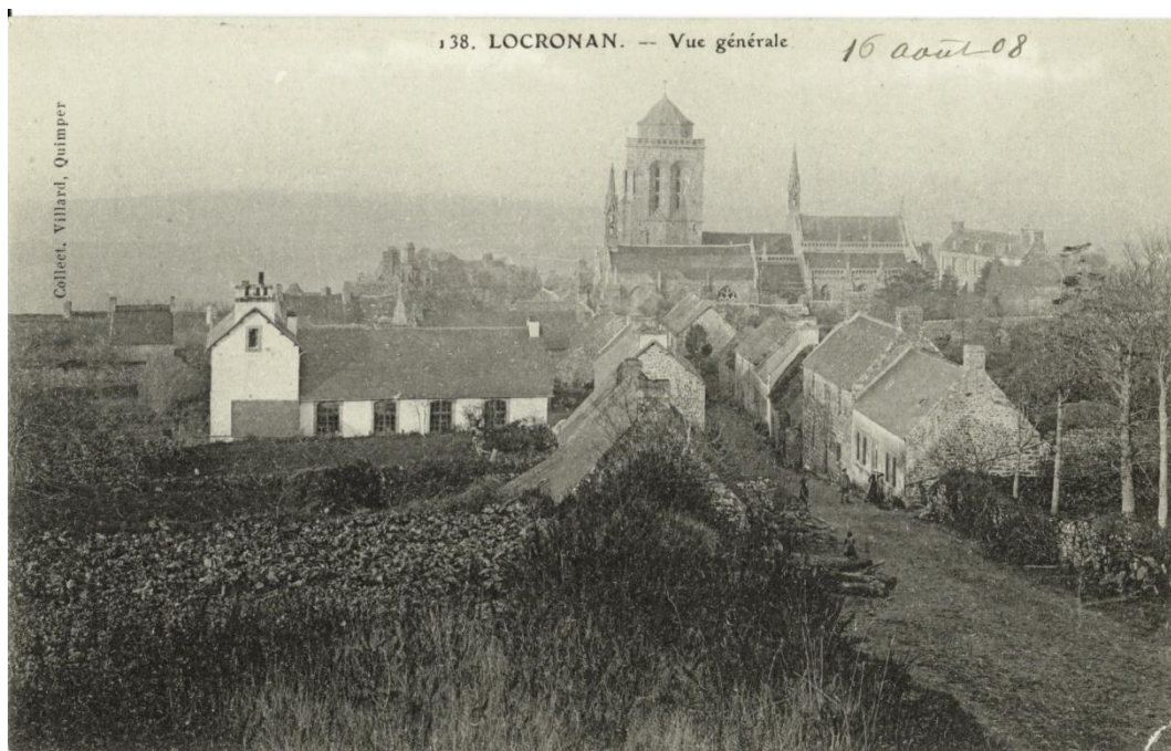
L'école des filles vers 1900, à droite de l'église. Construite vers 1860, c'est aujourd'hui le musée municipal. Tout à gauche la nouvelle école de garçons de 1898.

Les écoles religieuses vont renaître en 1905 sous la dénomination d'écoles libres. Leur implantation devra beaucoup aux dons d'une riche veuve nantaise, Madame Lemonnier.